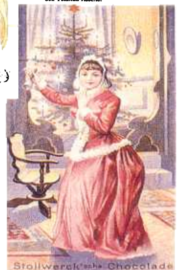
Publicidade do Chocolate Stollwerck de 1897 - Col. Museo Della Figurina.