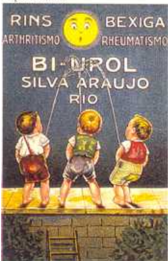
Um dos mais deliciosos postais de produtos farmacêuticos -.

Quando em 1869 surgiu o primeiro Cartão-Postal no império Austro-Hungaro, com a finalidade de baratear o custo das tarifas postais, apareceram as primeiras mensagens especificamente publicitárias.