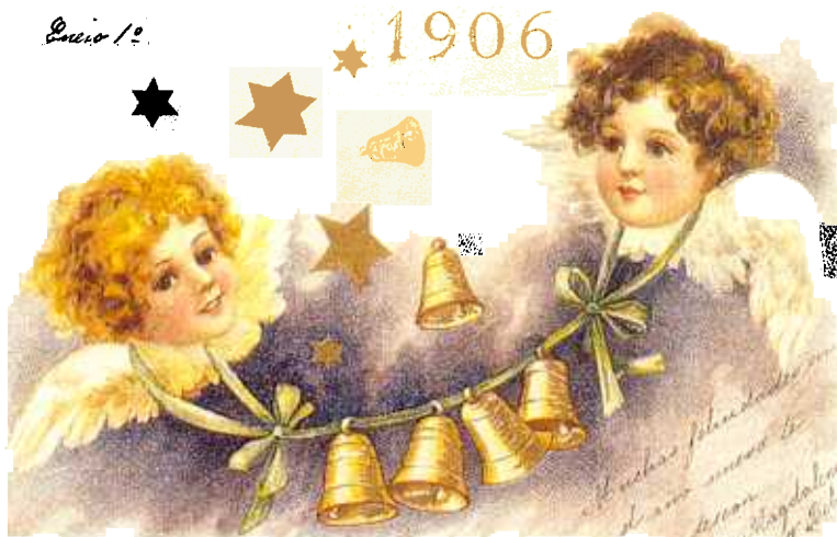
Anjinhos ou querubins bem como os sinos, são outros símbolos de Natal.