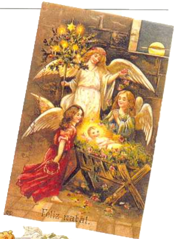
O menino Jesus na manjedoura. O símbolo maior do Natal. Col. Elysio O. Belchior

Vários temas serão abordados em outras exposições entre eles o projeto Os símbolos de Natal em Cartões-Postais , para divulgar o que consideramos, talvez, a maior festa cujo espírito mais se enquadra de uma forma tão romântica quanto religiosa na publicidade o Natal . Este tema sempre atual, se renova todos os anos, crescendo como bola de neve. Os símbolos ilustrados em postais remontam à imagem de Jesus, à chegada dos Reis Magos trazendo presentes, continuando pela figura lendária de São Nicolau e da nova versão do velhinho bondoso Papai Noel que traz para todos mensagens de paz.