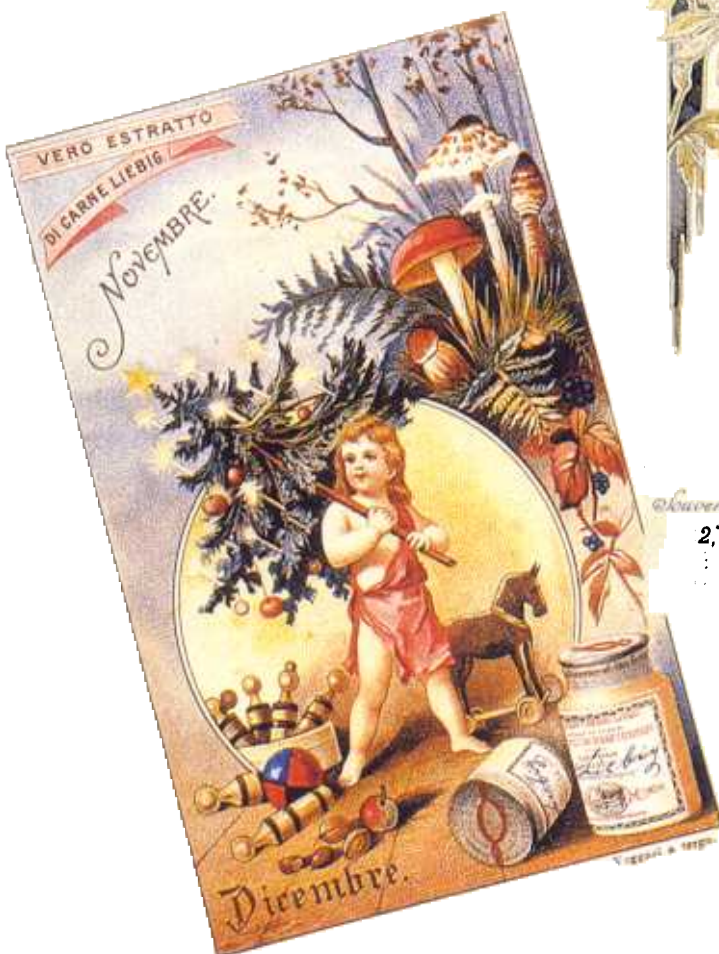
Publicidade do Extrato di Carne Liebeg com os meses do ano 1894. Col. Museo Della Figurina.

Vários temas serão abordados em outras exposições entre eles o projeto Os símbolos de Natal em Cartões-Postais , para divulgar o que consideramos, talvez, a maior festa cujo espírito mais se enquadra de uma forma tão romântica quanto religiosa na publicidade o Natal . Este tema sempre atual, se renova todos os anos, crescendo como bola de neve. Os símbolos ilustrados em postais remontam à imagem de Jesus, à chegada dos Reis Magos trazendo presentes, continuando pela figura lendária de São Nicolau e da nova versão do velhinho bondoso Papai Noel que traz para todos mensagens de paz.