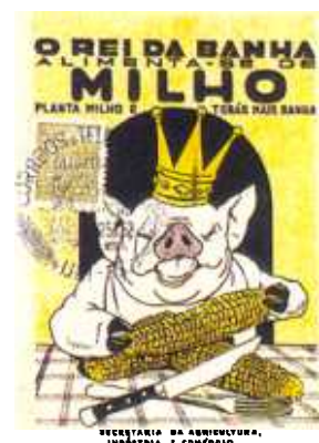
SECRETARIA DA AGRICULTURA, INDÚSTRIA E COMÉRCIO.