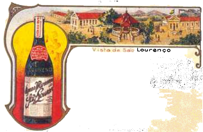
Belíssima litografia do início do século anuncia a Água Mineral São Lourenço